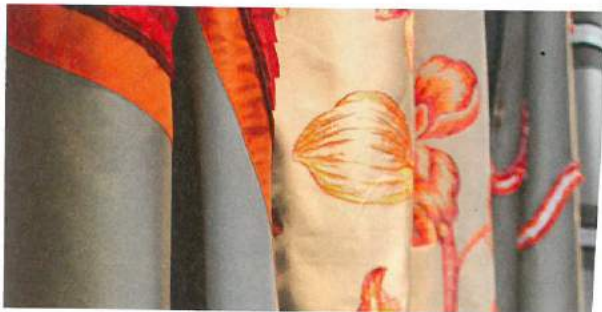
Die neue Kollektion von Dörfinger & Nickow schmücken applizierte Bänder und Stickereien