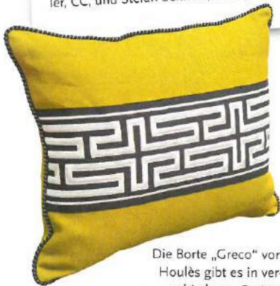
Die Borte „Greco“ von Houliès gibt es in verschiedenen Breiten