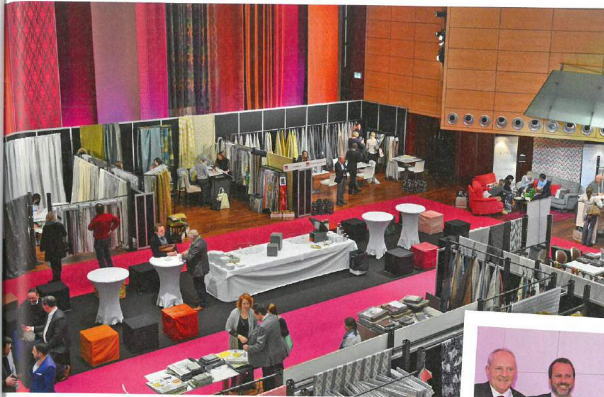
Blick in den Europasaal: Hier stellen Anbieter aus dem Hochpreissegment aus – willkommen auf der Belétage der Belétage