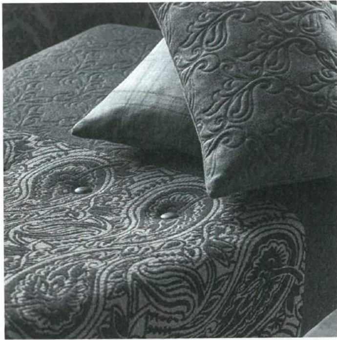
Gelungene Kombination: „Lana Highland“ verbindet klassische Karo-, stilvolle Paisleymuster und Ornamente mit besinnlichen Unis in ruhigen Tönen

Trend 2018: Englisch Dekor greift mit seiner Kollektion „Lana Highland“ das Paisleymuster wieder auf