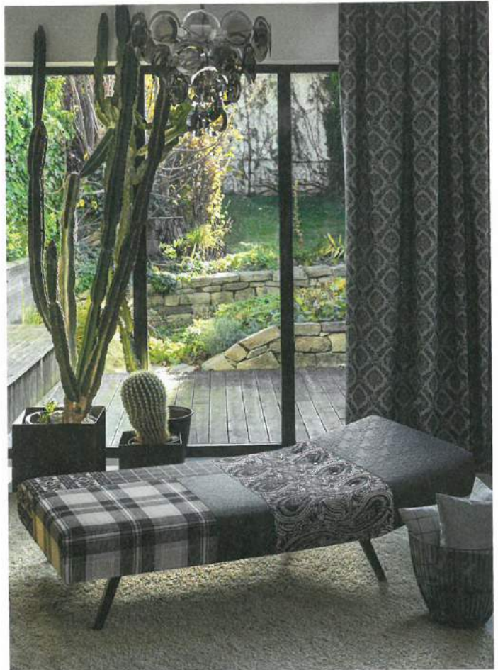
Verschiedene Dessins aus 70 Prozent regenerierter und CO 2 -neutral produzierter Wolle prägen die neue Kollektion