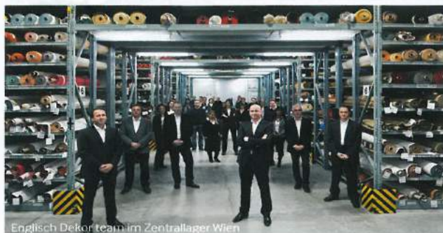
Englisch Dekor team im Zentrallager Wien

T +43 1 891 07 0 office@englisch.at www.englisch.at