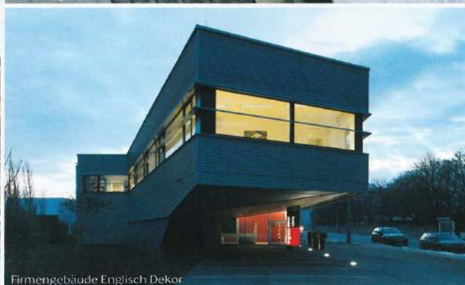
Firmengebäude Englisch Dekor