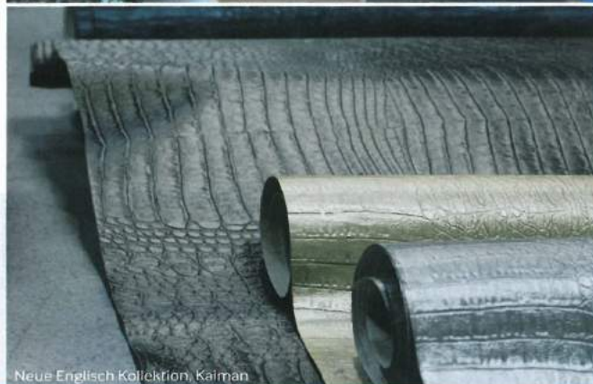
Neue Englisch Kollektion, Kaiman