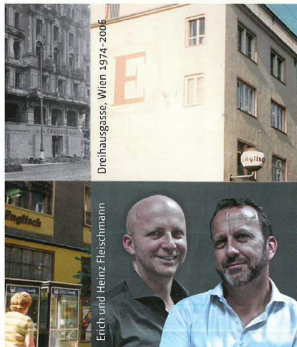
Dreihausgasse, Wien 1974-2006