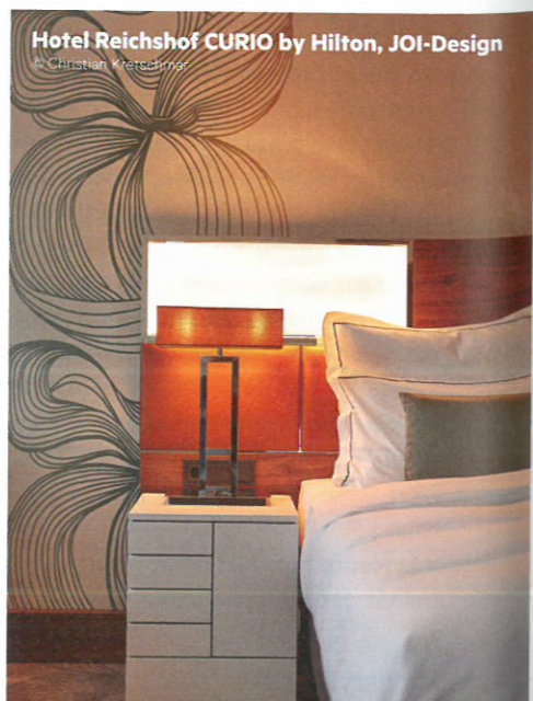
Hotel Reichshof CURIO by Hilton, JOI-Design