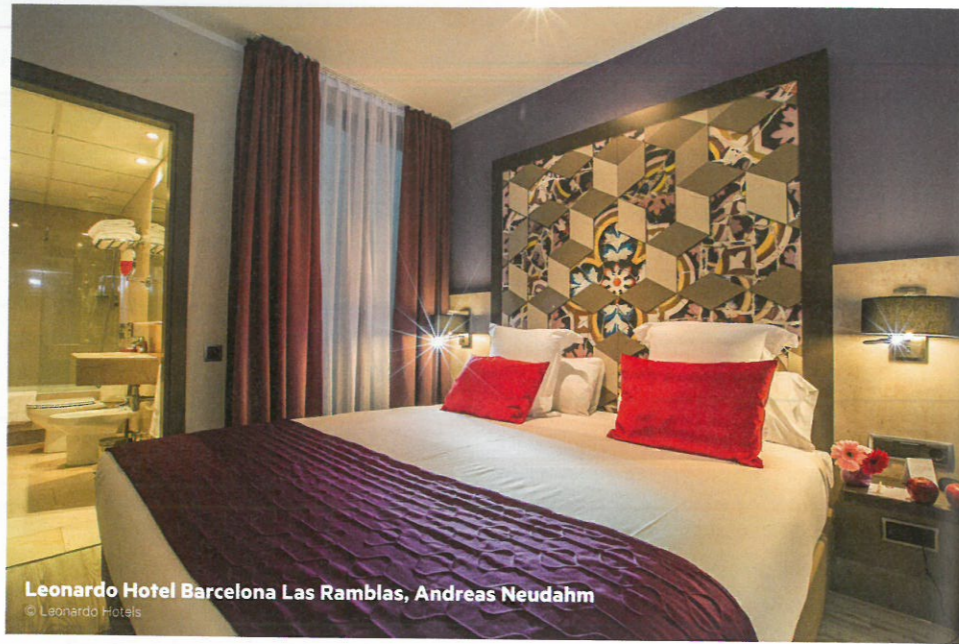
Leonardo Hotel Barcelona Las Ramblas, Andreas Neudahm © Leonardo Hotels

Was sind aus Ihrer Sicht die häufigsten Fehler und wie gelingt es, diese zu vermeiden?