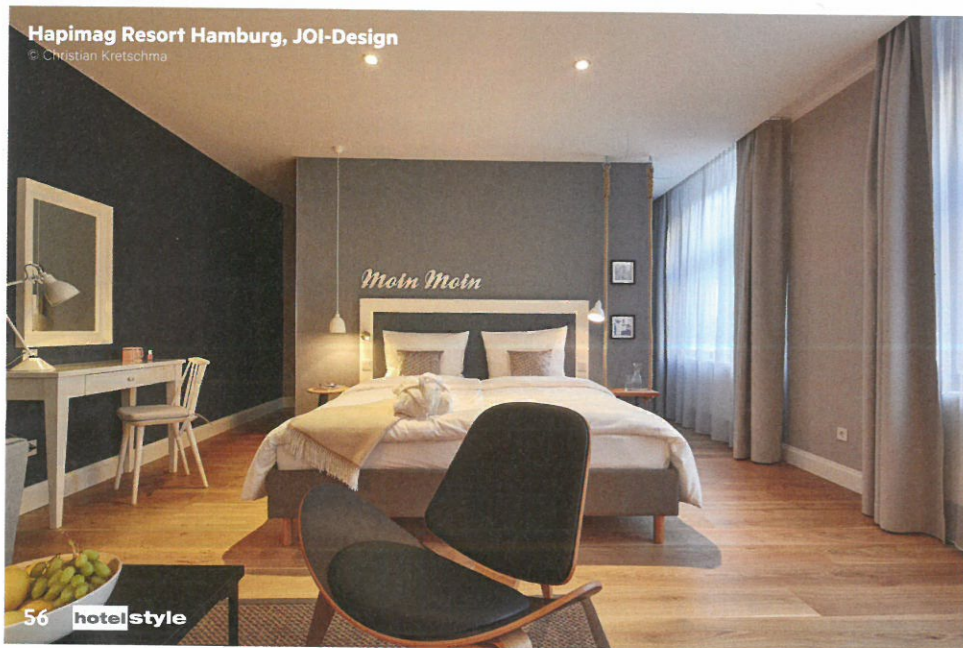
Hapimag Resort Hamburg, JOI-Design

www.behf.at www.JOI-Design.com www.atelier-heiss.at www.neudahmdesign.com