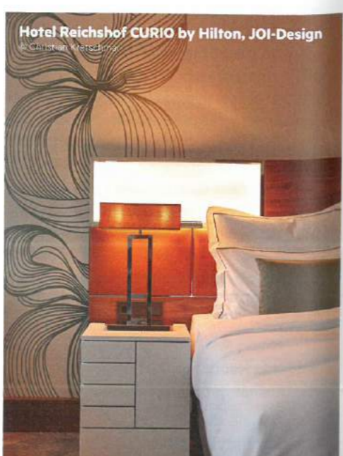
Hotel Reichshof CURIO by Hilton, JOI-Design © Christian Kretschmer