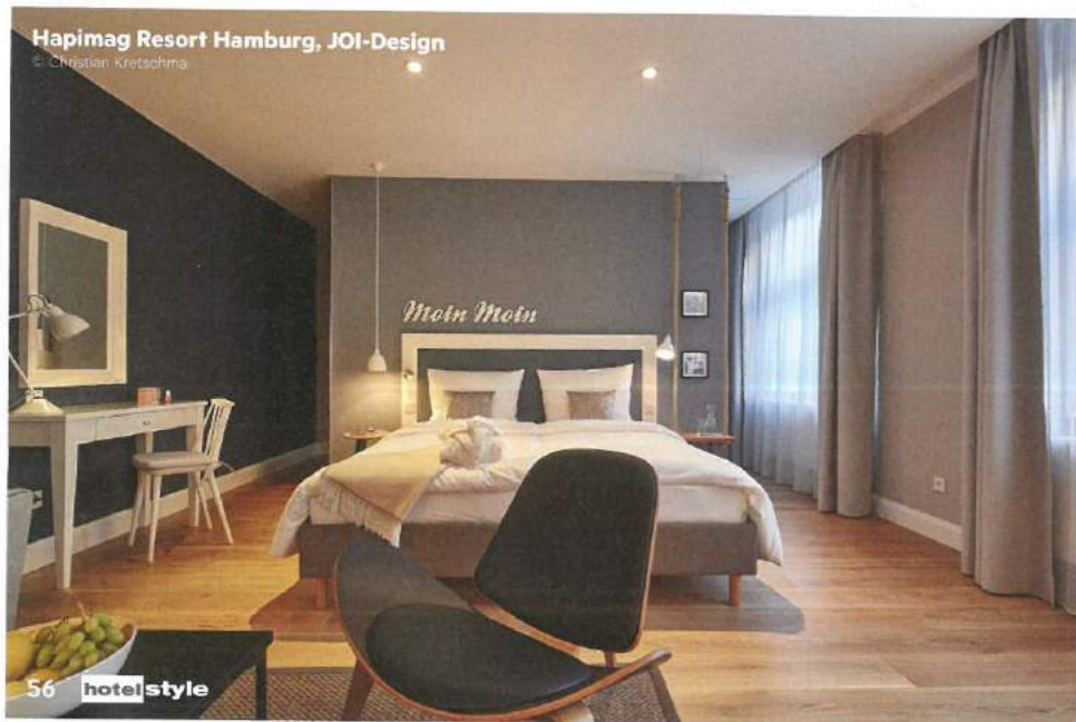
Hapimag Resort Hamburg, JOI-Design

www.behf.at www.JOI-Design.com www.atelier-heiss.at www.neudahmdesign.com