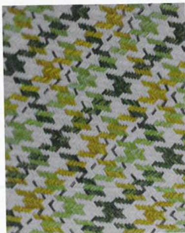
Neu: ein verformdetes Hahnentritt-Muster in frischen Farben