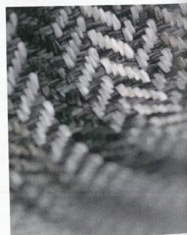
Griffige Strukturen treffen auf gute Pflegeeigenschaften