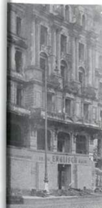
Dreihausgasse, Wien 1974-2006

Teba: innenliegender Sonnenschutz für den Fachhandel Sun Collection: Mitnahmeprogramm CeGeDe: außenliegender Sonnenschutz für den Fachhandel