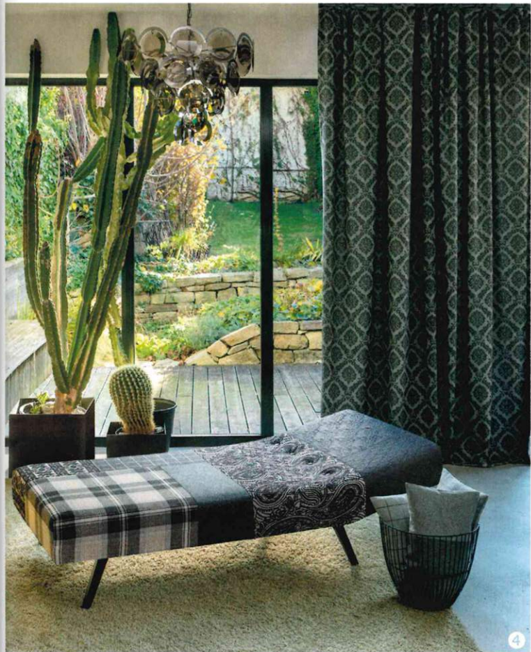
4_Natürlich schick: „Naturgeflüster“. 5_Neuer Lifestyle: Der neu interpretierte Chalet-Stil kombiniert Naturtöne und Holzfarben mit Industrial Design. Edel: „Cascade“. 6_Die textilen Kollektionen eröffnen viele Möglichkeiten für Raumgestaltung und Raumausstatter. Eindrucksvoll: „Magnolia“.