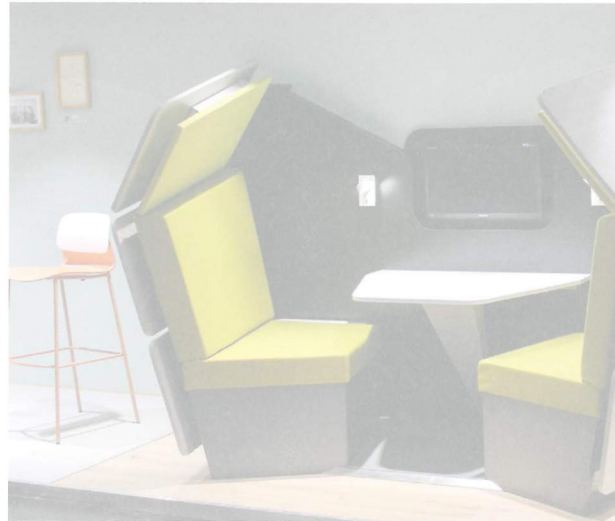
Akustisch abgeschirmte Besprechungsmodule ersetzen in Zukunft den geschlossenen Raum für diskrete Unterhaltungen.