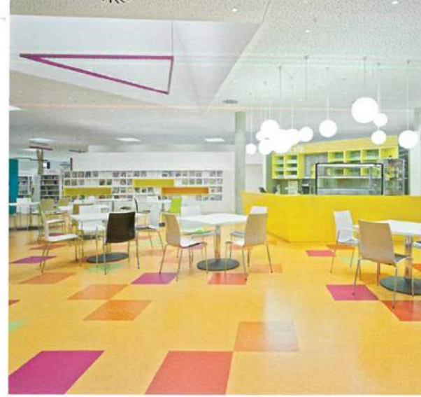
Kautschukboden Stone aus der Kollektion Noraplan in verschiedenen Sonderfarben von Nora Systems