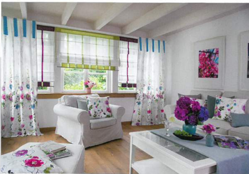
Kollektion Natural Feeling von Indes Fuggerhaus