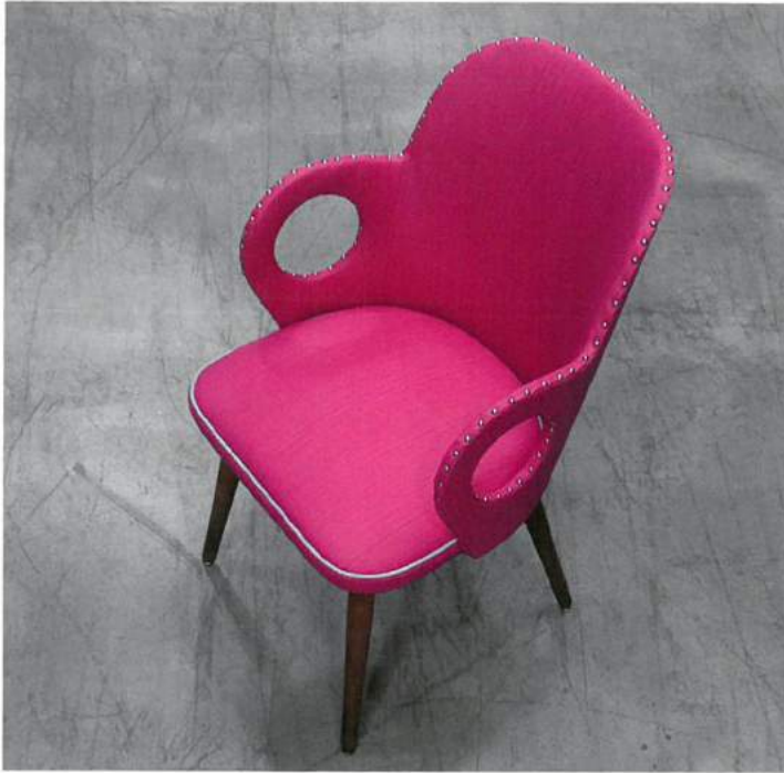
Möbelstoff Structura von Englisch Dekor