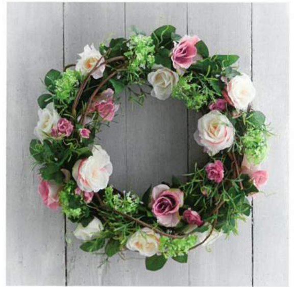
Blumenkranz von The Contemporary Home