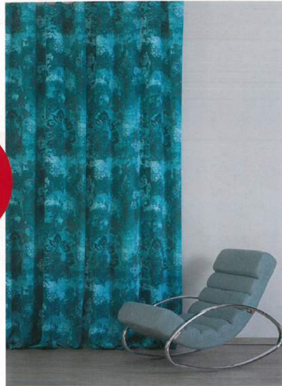
Zur Heimtextil hat Englisch Dekor auch Dim-Out-Neuheiten dabei.

Englisch Dekor Heimtextil Halle 3.0 | Ebene 0 Stand D86