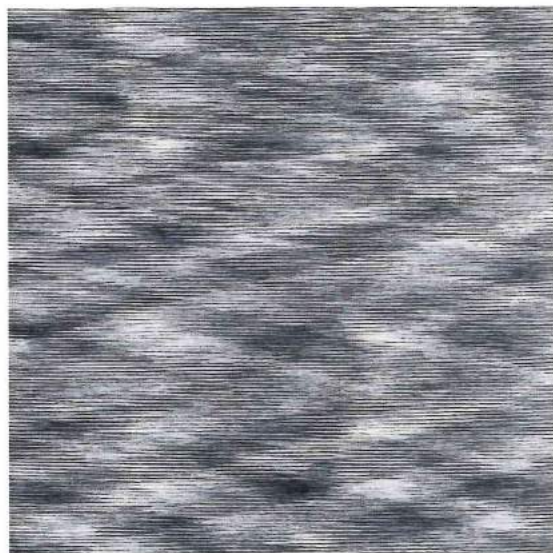
Verläufe von semi-uni über klein gemustert bis zu geometrisch ermöglichen die unterschiedlichsten Kombinationen.