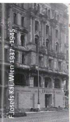
F. Josefs Kai, Wien 1937-1945