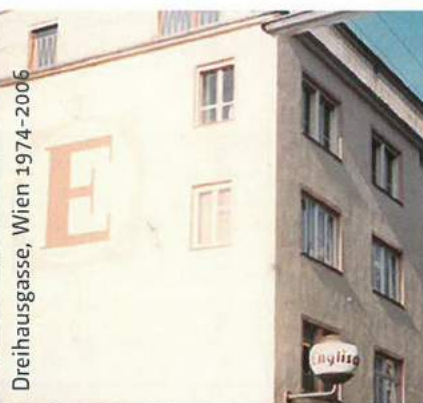
Dreihausgasse, Wien 1974-2006