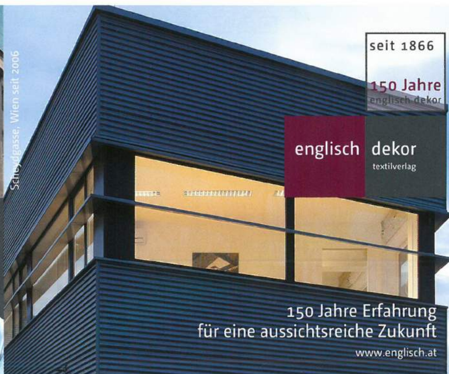
Schreyölgasse, Wien seit 2006